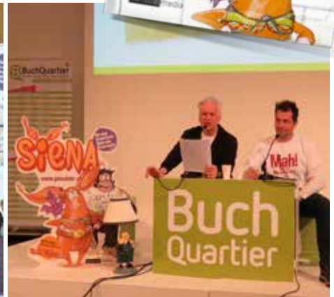
Buch Quartier im MQ

Ihr möchtet Siena und ihre Freunde live erleben? Nähere Informationen und Termine gibt es bei Markus unter 0664/884 67 406 oder abenteuer@pinselohr.at