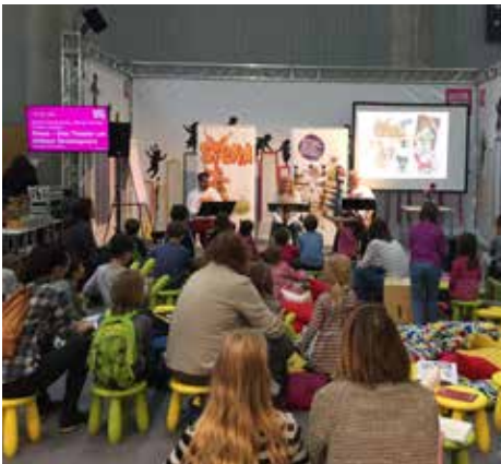
Buch Wien 2017